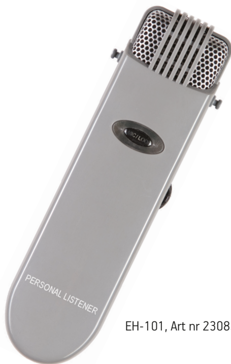
EH-101, Art nr 230850