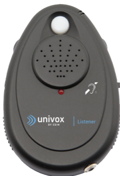
Univox® Listener Art nr 230450/230453